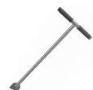
Chave 30 cm x 100 cm Alumínio com pega anatômica