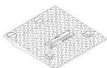
Rampa 55 cm x 55 cm Norma ABNT 9050