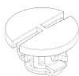
Conector 6 cm x 4 cm em nylon industrial