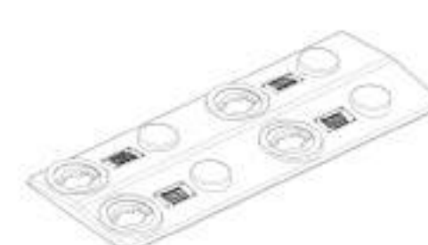
Módulo 55 cm x 20 cm Encaixe de rampas